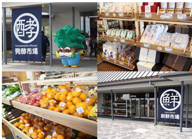
道の駅「発酵の里こうざき」からの学びも...

現時点では、道の駅の可能性を模索しています。地域を広げ、「知多の恵み」をカテゴリリーとすることを提案したいと思っています。「知多の恵み」をブランドに仕立てることで、差別化ができるはずです。最終的には専門家の提案に委ねることになりますが、成功の可能性を広げるための議論を重ねて参ります。