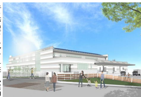
新学校給食センターのイメージ

令和6年9月の供用開始を目指し、新学校給食センターの建設を進めています。新施設は感染症やアレルギー除去などに対応し、最新の管理システムで運営されることです。高度な管理能力が求められる給食センター調理は、実績のある専門の企業へ委託することが妥当だと思っています。委託はプロポーザル方式で行うのですが、質を確保する契約となるよう内容の精査が必要です。