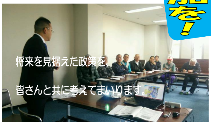
将来を見据えた政策を 皆さんと共に考えてまいります。

事務所:半田市瑞穂町5-3-18 Tel&fax:0569-58-0967 E-mail:y-koide@cac-net.ne.jp